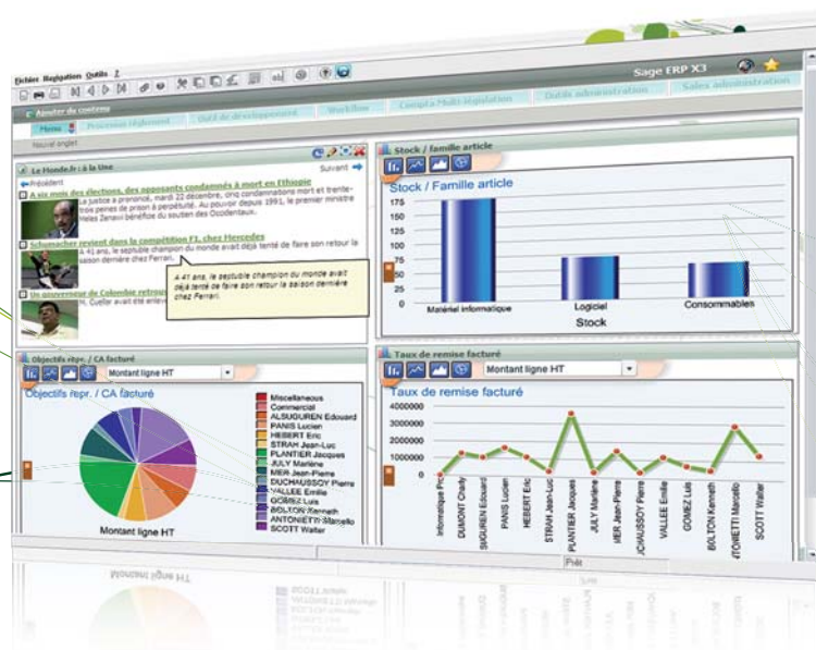
Das Web 2.0-Portal erlaubt Ihnen den Echtzeitzugriff auf Ihre Geschäftsindikatoren.

Quelle: Sage-Umfrage 2009, durchgeführt von Ernst & Young Advisory